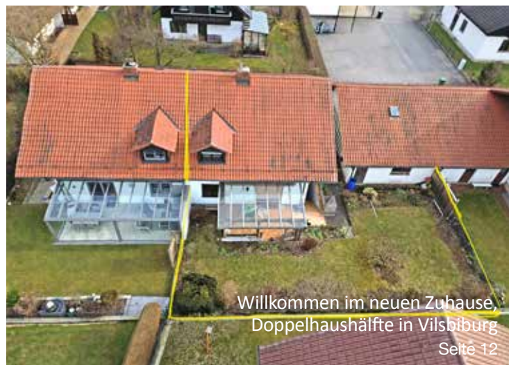
Willkommen im neuen Zuhause Doppelhaushälfte in Vilsbiburg Seite 12