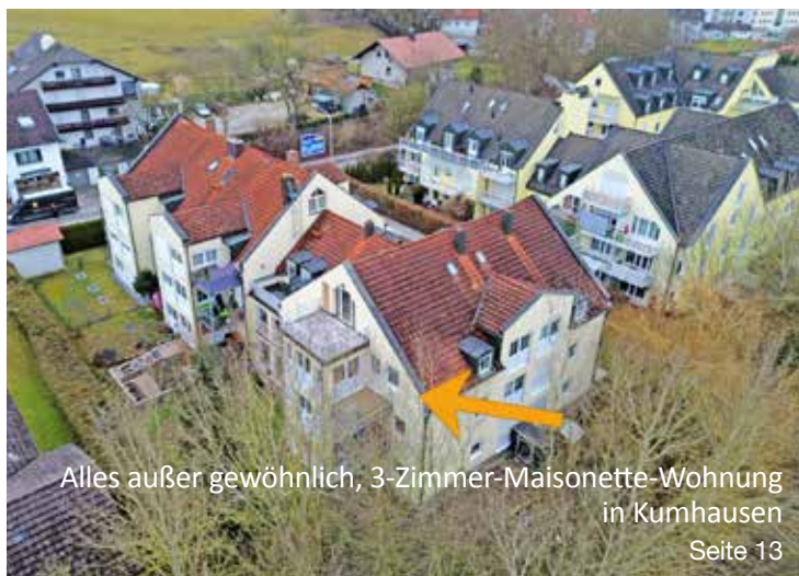
Alles außer gewöhnlich, 3-Zimmer-Maisonette-Wohnung in Kumhausen Seite 13