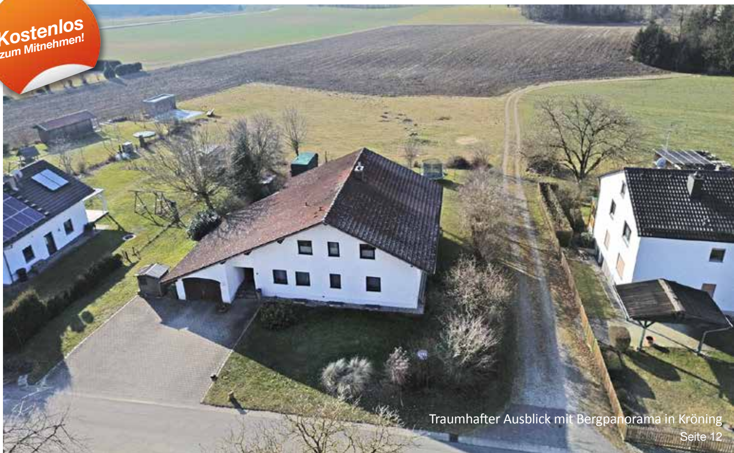
Traumhafter Ausblick mit Bergpanorama in Kröning Seite 12